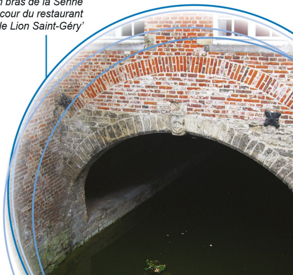
Ancien bras de la Senne dans la cour du restaurant 'le Lion Saint-Géry'

L'état sanitaire de la Senne, véritable égout à ciel ouvert et vecteur important de maladies, justifie à l'époque son recouvrement. Aujourd'hui, les choses se sont améliorées avec la construction de deux stations d'épuration nettoyant l'ensemble des eaux usées de Bruxelles.